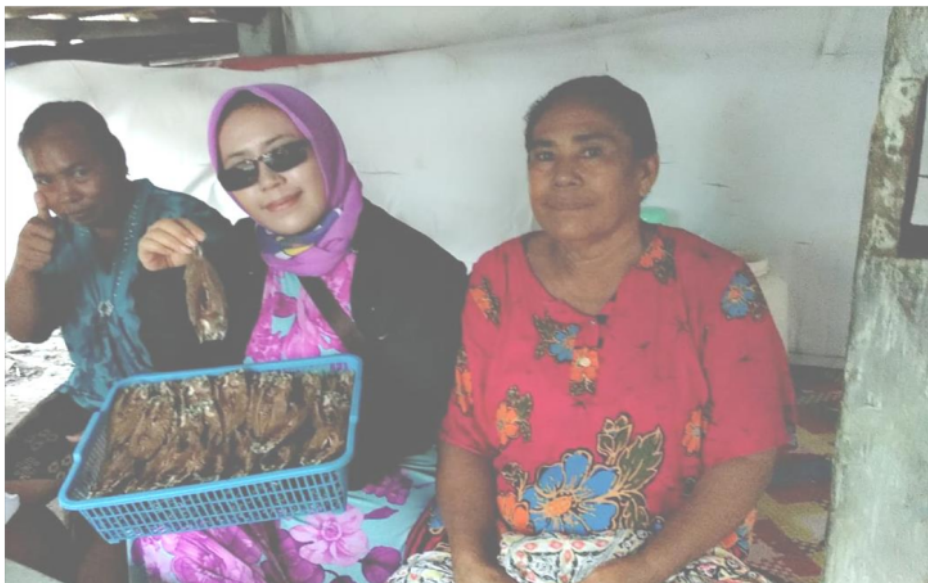
Gambar 2. Pemasaran ikan olahan khas Sumbawa “jangan bage” melalui media WhatsApp