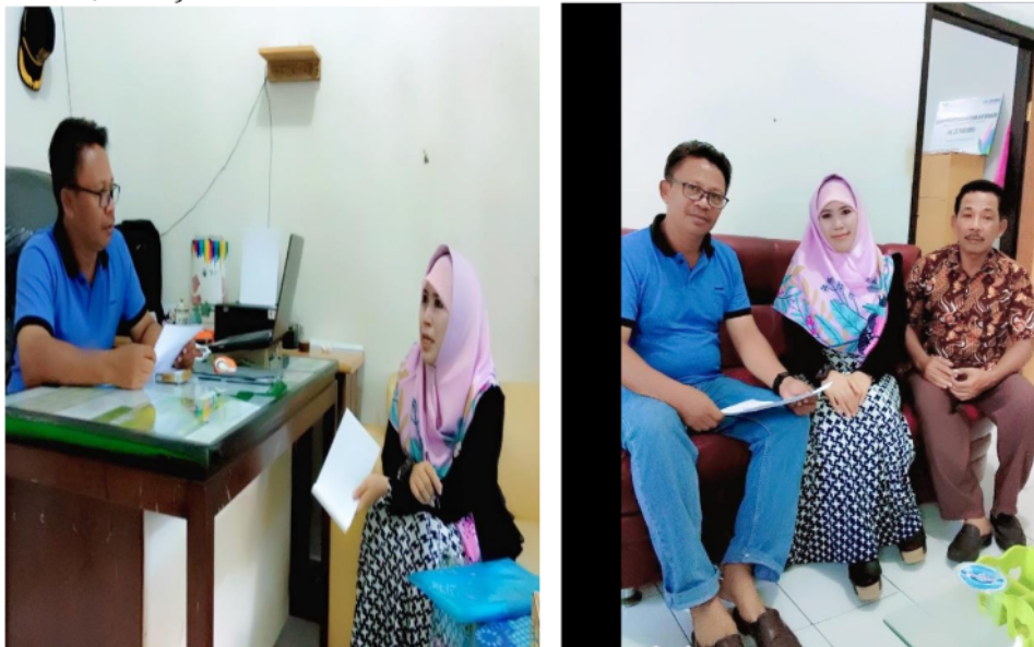
Gambar 3. Diskusi dan wawancara bersama Kepala Desa Labuhan Sumbawa

Mengacu kriteria konsep Badan Pusat Statistik (BPS) indikator kesejahteraan masyarakat meliputi, tingkat pendapatan (daya beli masyarakat), tingkat kesehatan (angka harapan hidup), tingkat pendidikan (angka melek huruf) dan rata-rata lama sekolah (BPS Provinsi Bali, 2011).